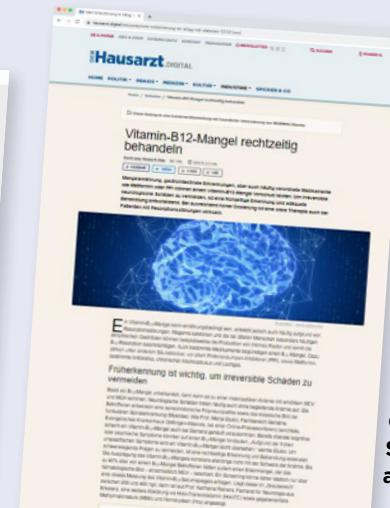
Online Streckenverlängerung aus Print