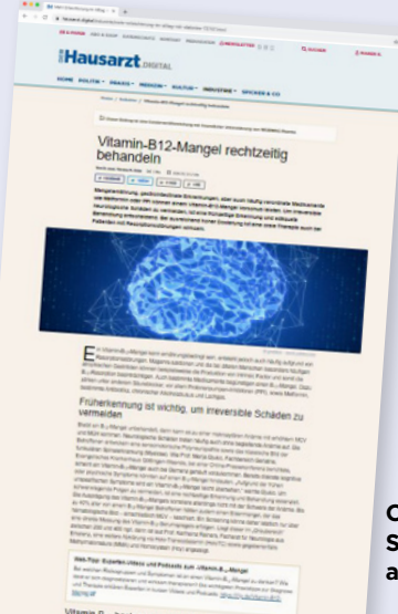
Online Streckenverlängerung aus Print