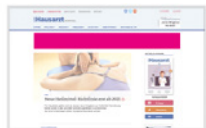
IAB Large Leaderboard* 970 x 90 Pixel max. 50 kByte