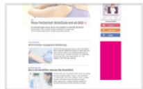
Vertical Rectangle 200 x 400 Pixel max. 40 kByte