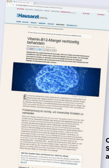
Online Streckenverlängerung aus Print