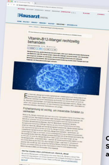
Online Streckenverlängerung aus Print