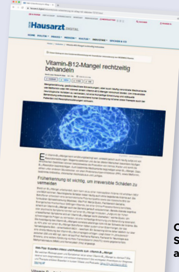
Online Streckenverlängerung aus Print